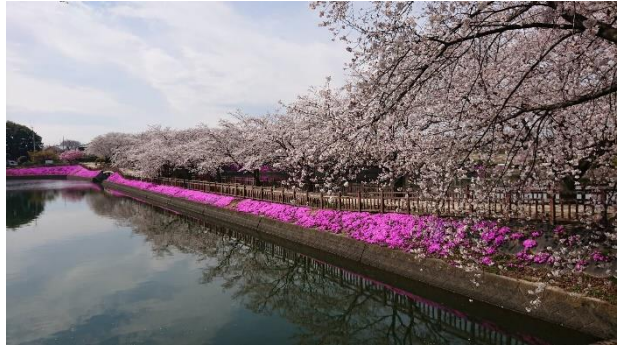
今年の谷地沼親水公園です。芝桜・水仙もきれいな近くの名所です。