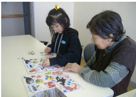
ばあちゃんとゴロゴロ(笑)

コロナウイルスの影響で学校が休校に。「すくすくさわやか」の利用も増えています。利用者様の「癒し」♡になっています。